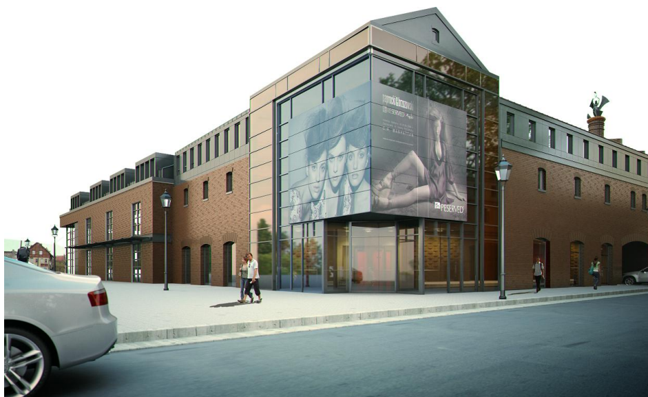
II. 3: Obiekt po rewitalizacji - wizualizacja, Stary Browar Kościerzyna Sp. z o.o

W roku 2010 rozpoczęły się szeroko zakrojone przygotowania do nowej inwestycji, gromadzono niezbędną dokumentację. Godnym pochwały jest fakt, że nowy właściciel rozpoczął prace budowlane od badań archeologicznych na terenie kompleksu. Podczas wykopalisk, na terenie ok. 1800 m 2 , odkryto m.in. fundamenty baszty obronnej z XV w., budynków mieszkalnych i przemysłowych (w tym pozostałości naszego browaru, ze studnią, z której czerpano wodę, oraz fundamenty magazynów z XIX stulecia) z XVIII i XIX w. oraz znaleziono ok. 15 tys. przedmiotów lub ich fragmentów – kafli piecowych, butelek, fragmentów posadzek itp. Część pozyskanych w ten sposób bezcennych materialnych źródeł historii miasta zostanie zdeponowana w Muzeum Kościerskim, a część – co zasługuje na podkreślenie – będzie wyeksponowana w salach zrewitalizowanego obiektu. Przeszklenia w ścianach i posadzkach w pomieszczeniach piwnicznych posłużą prezentacji wybranych fragmentów dziedzictwa dawnej Kościierzyny. Jak dotąd, największym wyzwaniem podczas prac budowlano-konserwatorskich była renowacja skrzydła powstającego na bazie starej słodowni. Wysoki na ponad 16 m budynek, który dodatkowo – z upływem czasu – odchylił się od pionu o ok. 12 cm, wymagał wymiany fundamentów. Obiekt udało się zabezpieczyć na grubszych niż oryginalne ścianach fundamentowych oraz ławach żelbetonowych.