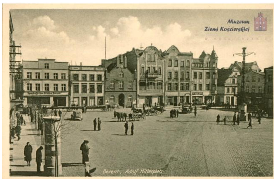
Il. 1: Kościerzyna, Rynek 1940 r.

Do bardziej interesujących, realizowanych obecnie projektów rewitalizacji obiektu poprzemysłowego można z pewnością zaliczyć adaptację do nowych funkcji dawnego browaru, a ściślej – słodowni, w Kościerzynie. To pełne uroku, liczące sobie już ponad sześćset lat miasteczko, stanowiące dziś – razem z pobliskimi Kartuzami – centrum turystyczne, kulturalne i rekreacyjne Szwajcarii Kaszubskiej, już w XV w. notowane było m.in. jako miejsce warzenia piwa. Za najcenniejszy fragment kulturowego dziedzictwa miasta uważa się XIX-wieczną (i zachowały się dwie kamienice z wieku XVIII) zabudowę centrum, z kwadratowym rynkiem, pokrywające się z planem urbanistycznym dawnej Costeriny z końca XIV stulecia. Na początku XX w. Kościerzyna była miastem o charakterze rolniczo-handlowym. Funkcjonowały sklepy o różnym asortymencie, karczmy, a na rynku regularnie odbywały się targi. Rozwijał się przemysł, reprezentowany m.in. przez Zakłady Mięsne, Wytwórnę Wódek i Likierów oraz browar. Ten ostatni, czerpiący wodę z własnego ujęcia, słynął z dobrego gatunkowo piwa i znany był w całym regionie (w trunek zaopatrywali się w nim m.in. armatorzy statków).