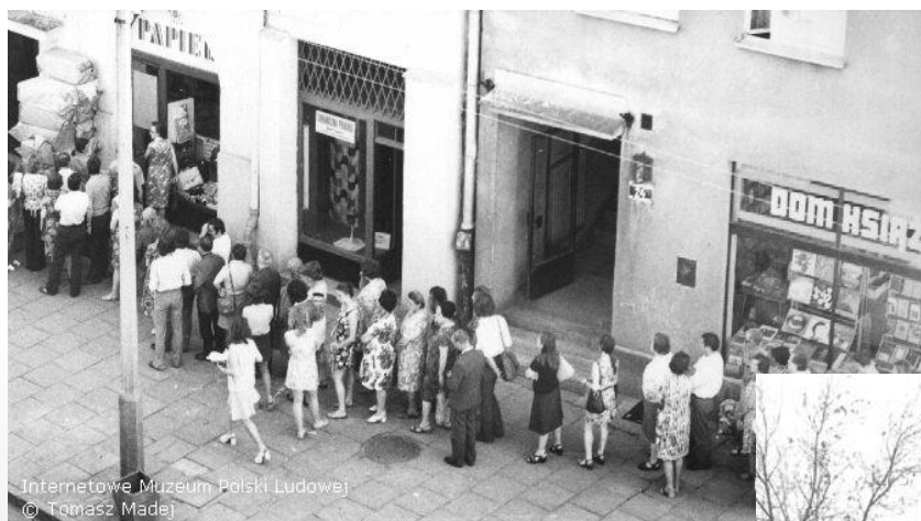
Internetowe Muzeum Polskiej Ludowej