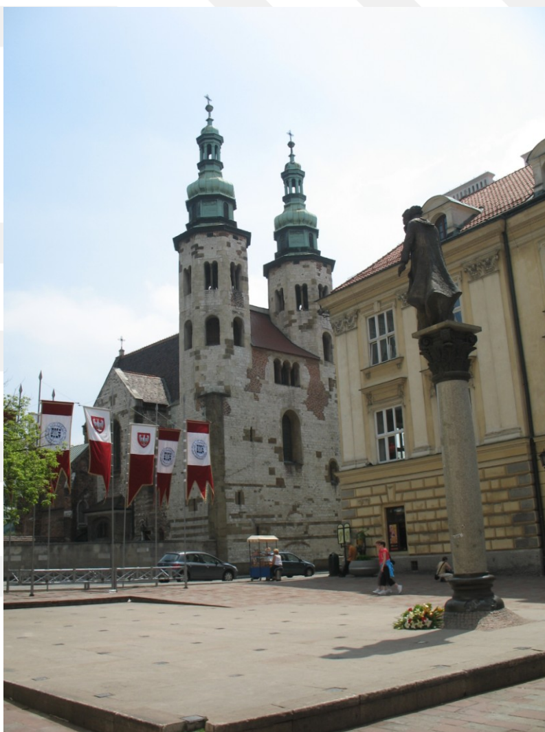
Rysunek 16. LO_klasa2_Histspolecz_T9_L5. Kościół św. Andrzeja w Krakowie.

Dominują proste geometryczne bryły, zrównoważone proporcje. Nawet kościelne budowle mają często charakter obronny, stąd nisko położone okna są niewielkie.