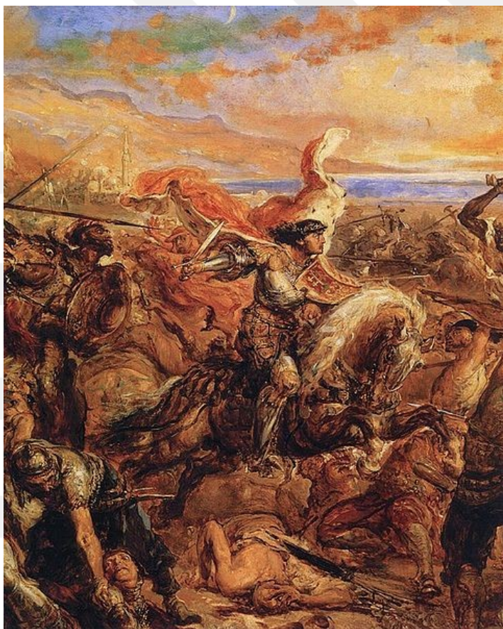
Rysunek 15. LO_klasa2_Histspolecz_T9_L5. Bitwa pod Warną – mal. Jan Matejko.

Skierował wysiłek państwa polskiego ku zagrożonym przez Turków Węgrom, zdobywając dla Władysława III koronę węgierską. Wykupił Księstwo Siewierskie, które wraz z kupionym przez króla Księstwem Oświęcimskim było jedyną częścią Śląska pod polską władzą. Oleśnicki stał się jednym z twórców koncepcji Polski Jagiellońskiej i wywarł ogromny wpływ na kształt polityczny Europy Środkowej w tym okresie.