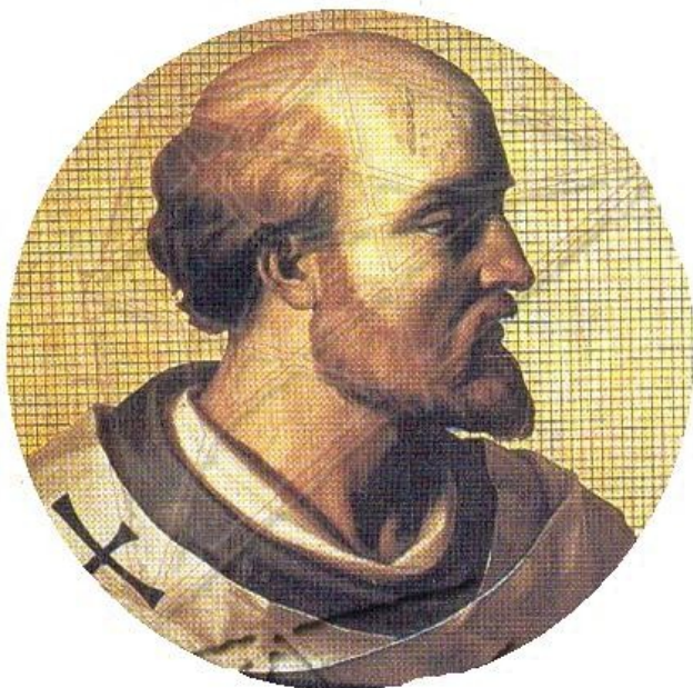
Rysunek 3. LO_klasa2_Histspolecz_T9_L5. Sylwester II.