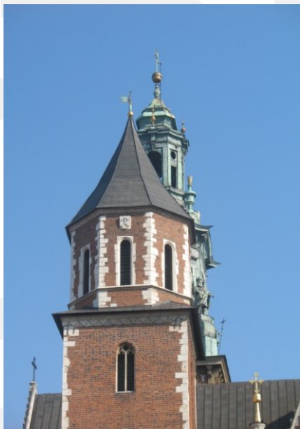
Rysunek 21. LO_klasa2_Histspolecz_T9_L5. Katedra Wawelska, gotycka część Wieży Srebrnych Dzwonów.