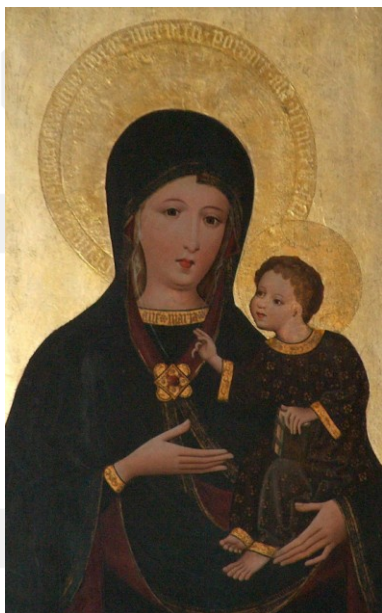
Rysunek 19. LO_klasa2_Histspolecz_T9_L5. Najświętsza Maria Panna z Dzieciątkiem (ołtarz w kościele) Wniebowzięcia Najświętszej Marii Panny w Radziszowie (XV w.).