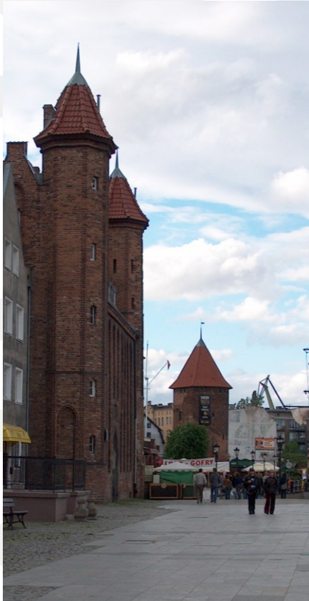
Rysunek 23. LO_klasa2_Histspolecz_T9_L5. Gdański gotyk.