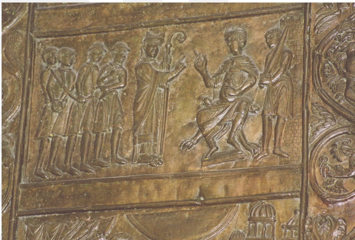
Rysunek 2. LO_klasa2_Histspolecz_T9_L5. Wezwanie do uwolnienia niewolników.

Sprzeciwiał się bezwzględnej surowości prawa, potępiał handel niewolnikami.