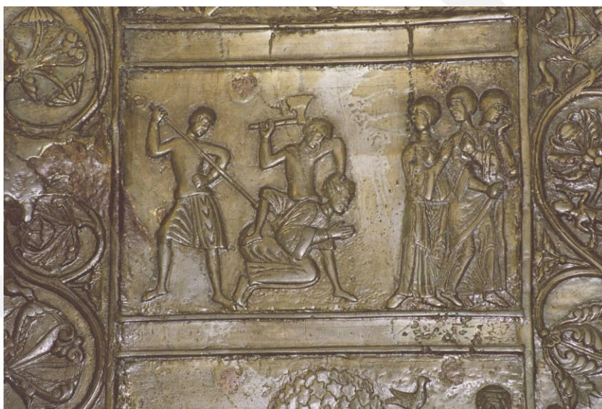
Rysunek 4. LO_klasa2_Histspolecz_T9_L5. Męczeństwo św. Wojciecha.

Brał udział w chrystianizacji ziem polskich. Zginął podczas wyprawy chrystianizacyjnej do Prusów. Jego ciało wykupił Bolesław Chrobry. Polska zyskała swojego męczennika i arcybiskupstwo.