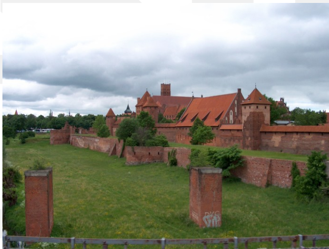
Rysunek 25. LO_klasa2_Histspolecz_T9_L5. Zamek w Malborku.