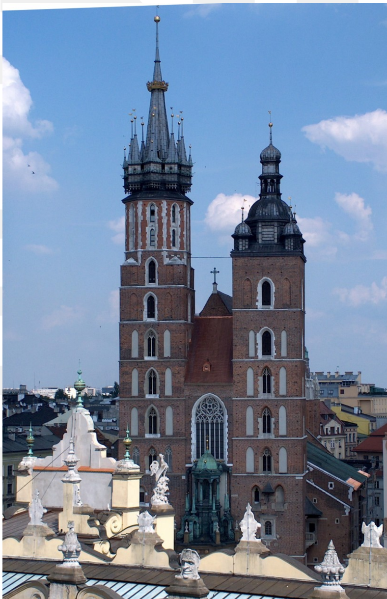
Rysunek 22. LO_klasa2_Histspolecz_T9_L5. Kościół NMP w Krakowie.