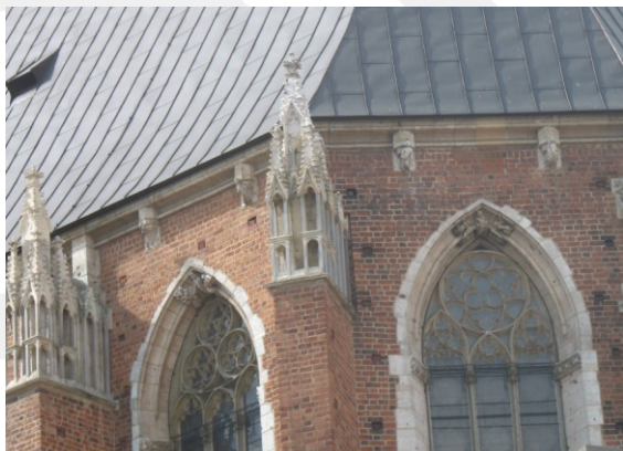
Rysunek 17. LO_klasa2_Histspolecz_T9_L5. Kościół NMP w Krakowie.

Sztuka gotycka. W Polsce pojawia się z końcem XIII w. Na naszych terenach są to najczęściej budowle ceglane (na wsiach – drewniane). Cechą charakterystyczną są ostre łuki, strzelistość budowli i bardzo wysokie, smukłe okna oraz pionowe zdobienia kamienne. Budowle tego typu powstają do XVI w.