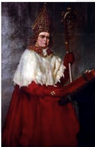
Rysunek 13. LO_klasa2_Histspolecz_T9_L5. Zbigniew Oleśnicki. Mal. Jan Matejko.

Zbigniew Oleśnicki – kardynał i biskup krakowski. Postać oceniana różnie – od entuzjazmu (Jan Długosz) do skrajnej krytyki. Obecnie mocno rehabilitowany. Przedstawiany przez Jana Matejkę jako osoba dostojna, lecz pełna pychy.