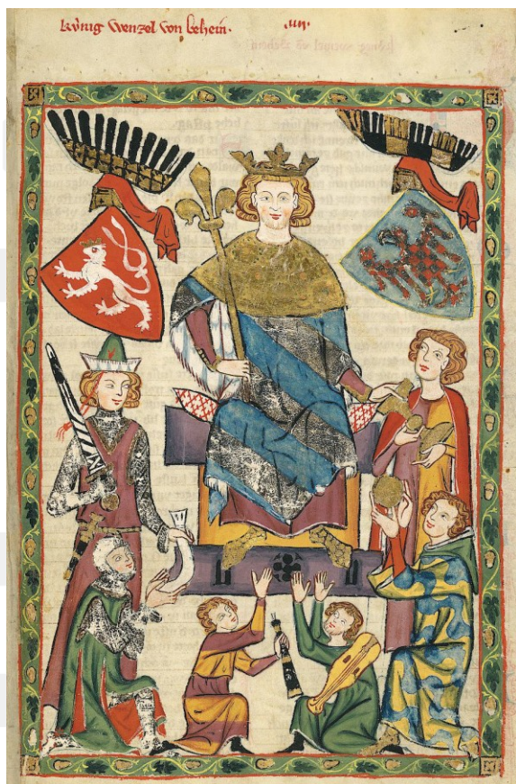
Rysunek 11. LO_klasa2_Histspolecz_T9_L5. Wacław II Czeski, miniatura z Kodeksu Manesse.