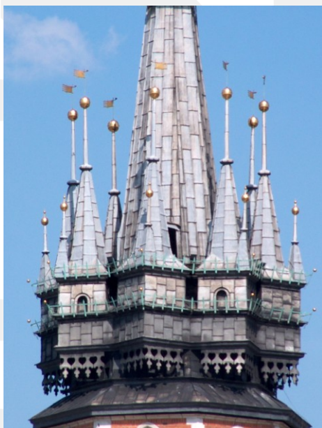
Rysunek 20. LO_klasa2_Histspolecz_T9_L5. Kościół NMP w Krakowie, gotycki hełm.