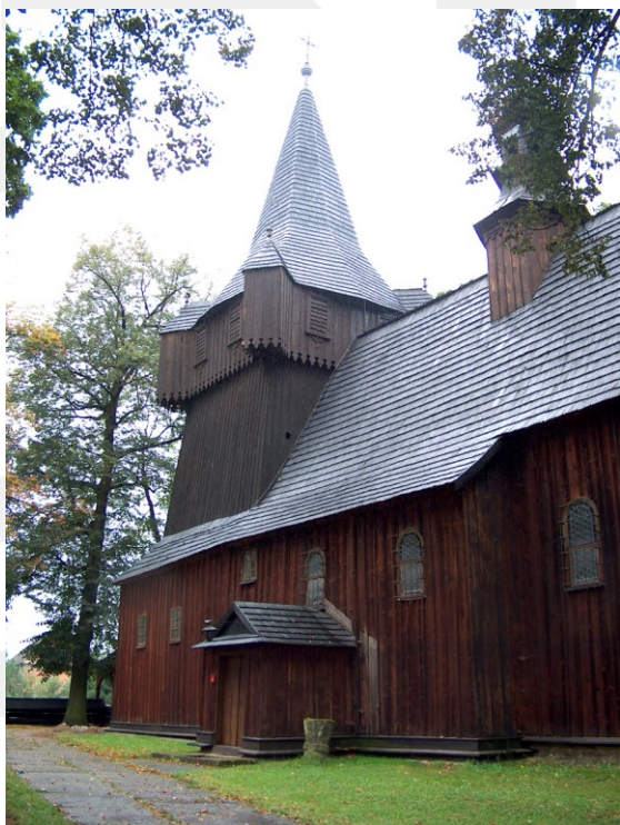
Rysunek 18. LO_klasa2_Histspolecz_T9_L5. Kościół Wniebowzięcia Najświętszej Marii Panny w Radziszowie (XV w.).