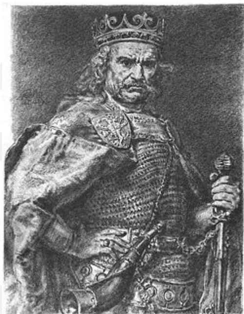
Rysunek 12. LO_klasa2_Histspolecz_T9_L5. Władysław Łokietek. Mal. Jan Matejko.