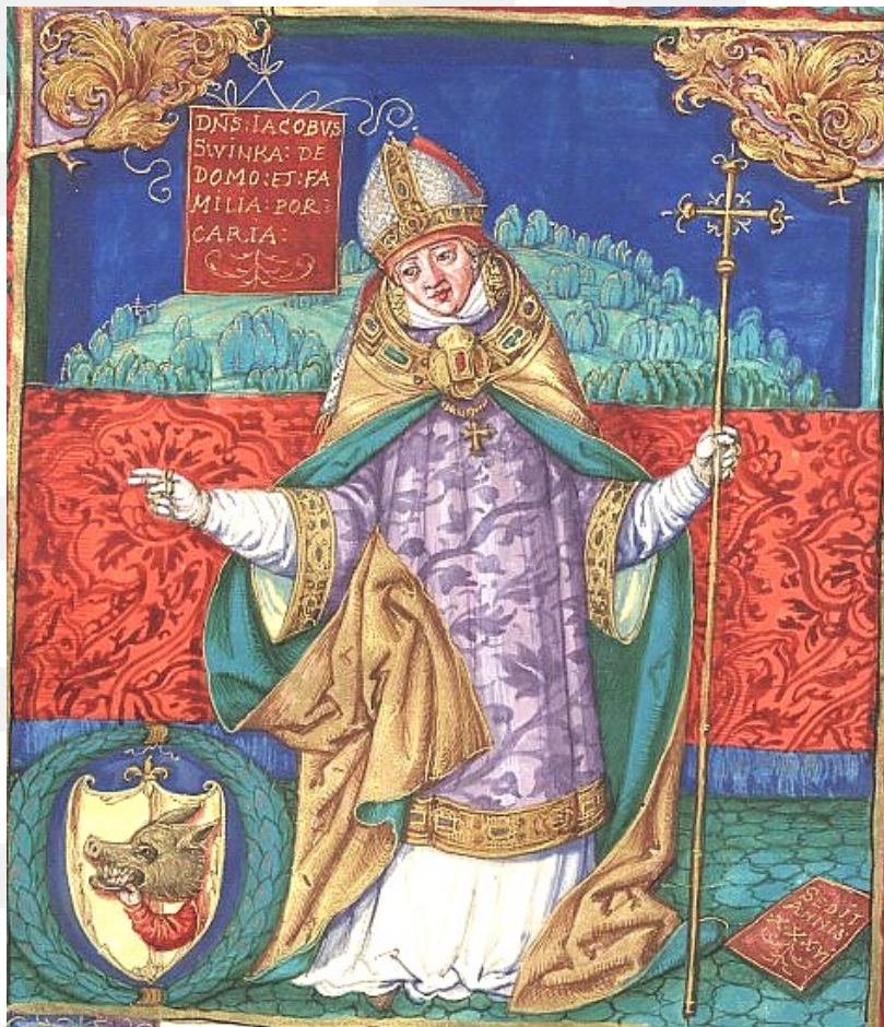
Rysunek 9. LO_klasa2_Histspolecz_T9_L5. Jakub Świnka – miniatura Stanisława Samostrzelnika.

Jakub Świnka. Był arcybiskupem w latach 1283-1314) – prawdziwy architekt zjednoczenia państwa polskiego, obrońca polskiego języka.