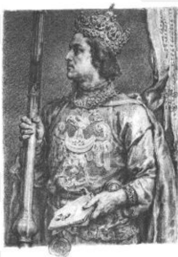
Rysunek 10. LO_klasa2_Histspolecz_T9_L5. Przemysław II. Mal. Jan Matejko.

Doprowadził do koronacji Przemysła II (1295), Wacława II Czeskiego (1300) i Władysława Łokietka (1320). Arcybiskup nakazał wręcz obowiązkową znajomość języka polskiego wśród duchownych i głoszenia kazań w tym języku. Obowiązkowo wspierał też kult narodowych świętych (zwłaszcza św. Wojciecha, ale też św. Stanisława).