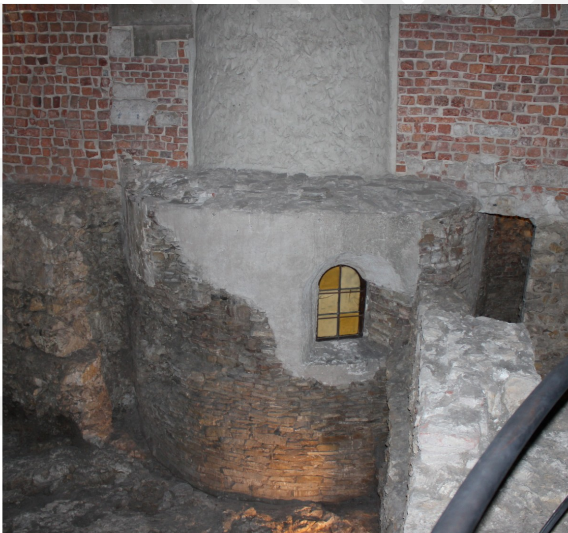
Rysunek 15. LO_klasa2_Histspolecz_T9_L5. Rotunda św. Feliksa i Adaukta na Wawelu.

Sztuka preromańska. W Polsce reprezentowana przez nieliczne i niekompletne zabytki, wiąże się z początkami chrześcijaństwa i akcją chrystianizacyjną Mieszka I i Bolesława Chrobrego. Są to niewielkie, zwykle okrągłe budowle kamienne.