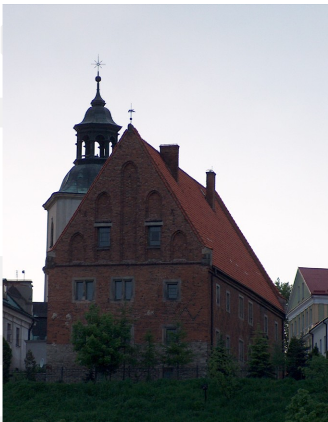
Rysunek 24. LO_klasa2_Histspolecz_T9_L5.

Dom Długosza w Sandomierzu.