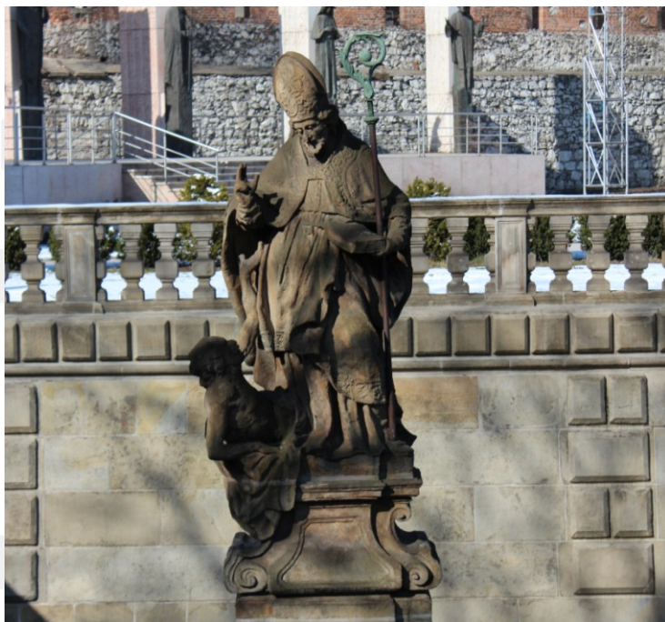
Rysunek 7. LO_klasa2_Histspolecz_T9_L5. Św. Stanisław ze wskrzeszonym Piotrem z Piotrawina. Barokowa rzeźba z z sanktuarium na Skałce.