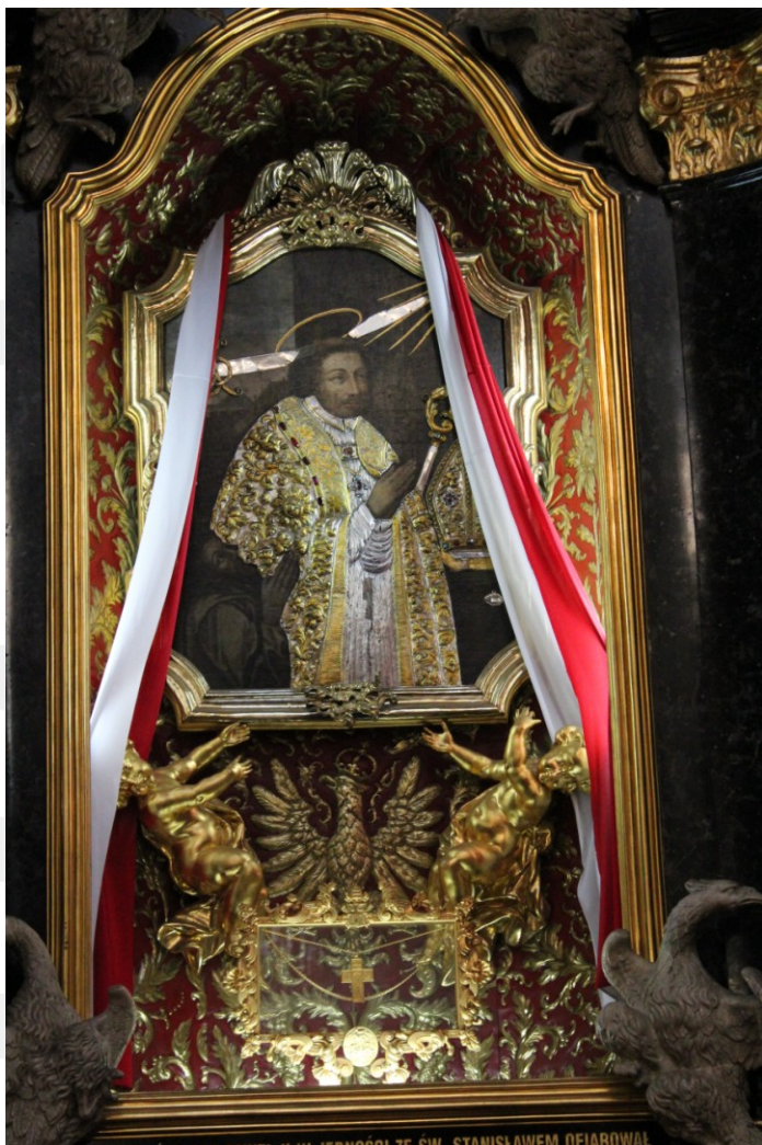
Rysunek 6. LO_klasa2_Histspolecz_T9_L5. Św. Stanisław przed ołtarzem. Barokowy obraz z sanktuarium na Skałce. Fot. Grzegorz Szymanowski