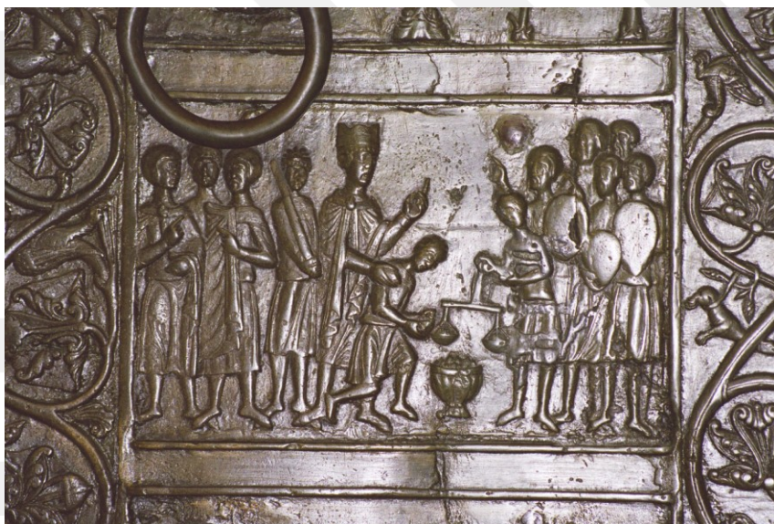
Rysunek 5. LO_klasa2_Histspolecz_T9_L5. Wykupienie ciała przez Bolesława Chrobrego. Fot. Grzegorz Szymanowski