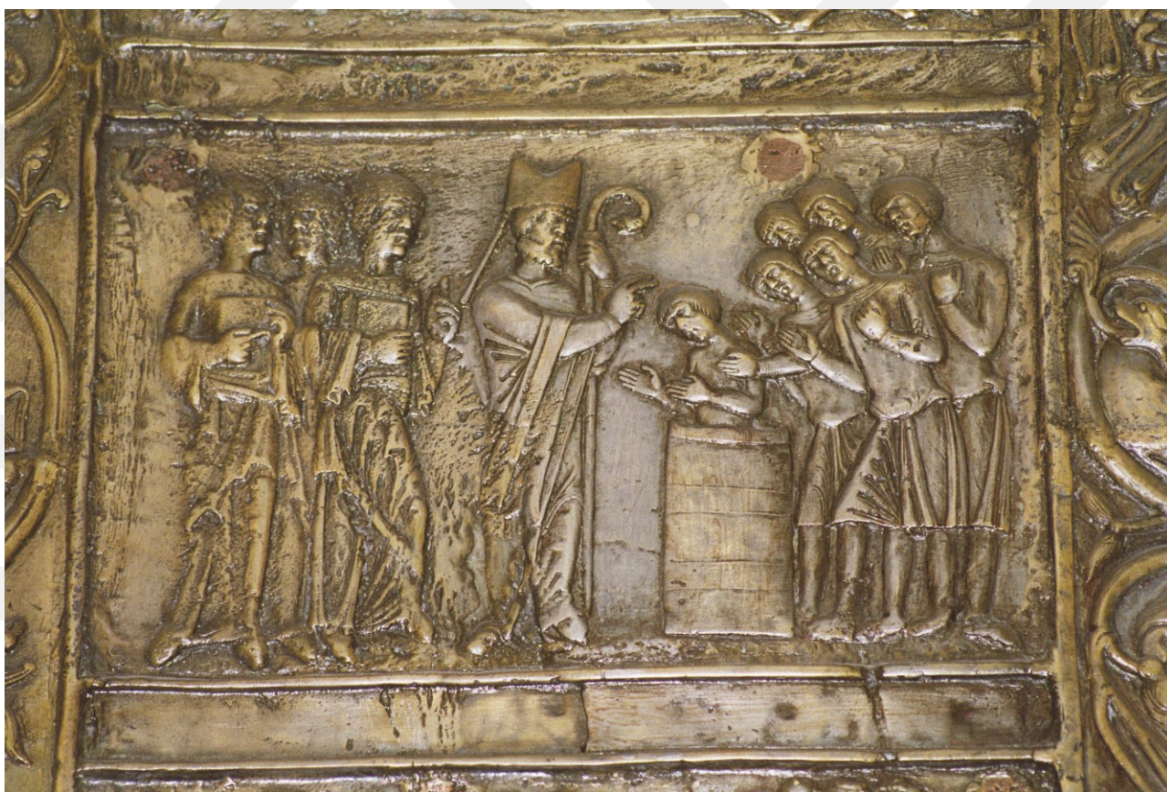
Rysunek 1. LO_klasa2_Histspolecz_T9_L5. Kazanie św. Wojciecha. Fot. Grzegorz Szymanowski Zasoby własne – osobny plik

X w. biskup praski, w ojczyźnie swej prześladowany z racji pochodzenia z konkurencyjnego wobec Przemysłidów rodu Sławnikowiców oraz bezkompromisowości moralnej.