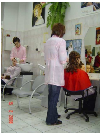
Zajęcia w pracowni fryzjerskiej