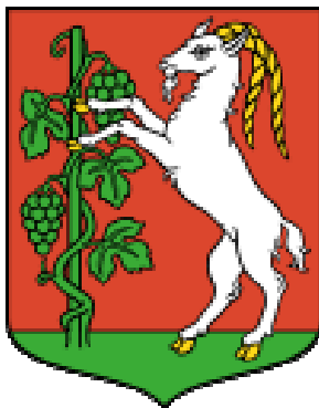
Herb miasta Lublin

W sąsiedztwie miasta leży wiele gmin, z których uczniowie kontynuują naukę w ZSOW: Bełżyce, Borzechów, Bychawa, Garbów, Głusk, Jabłonna, Jastków, Konopnica, Krzczonów, Niedzwica Duża, Niemce, Strzyżewice, Wojciechów, Wólka Lubelska, Wysokie, Zakrzew, Cyców, Ludwin, Łęczna, Milejów, Puchaczów, Spiczyn.