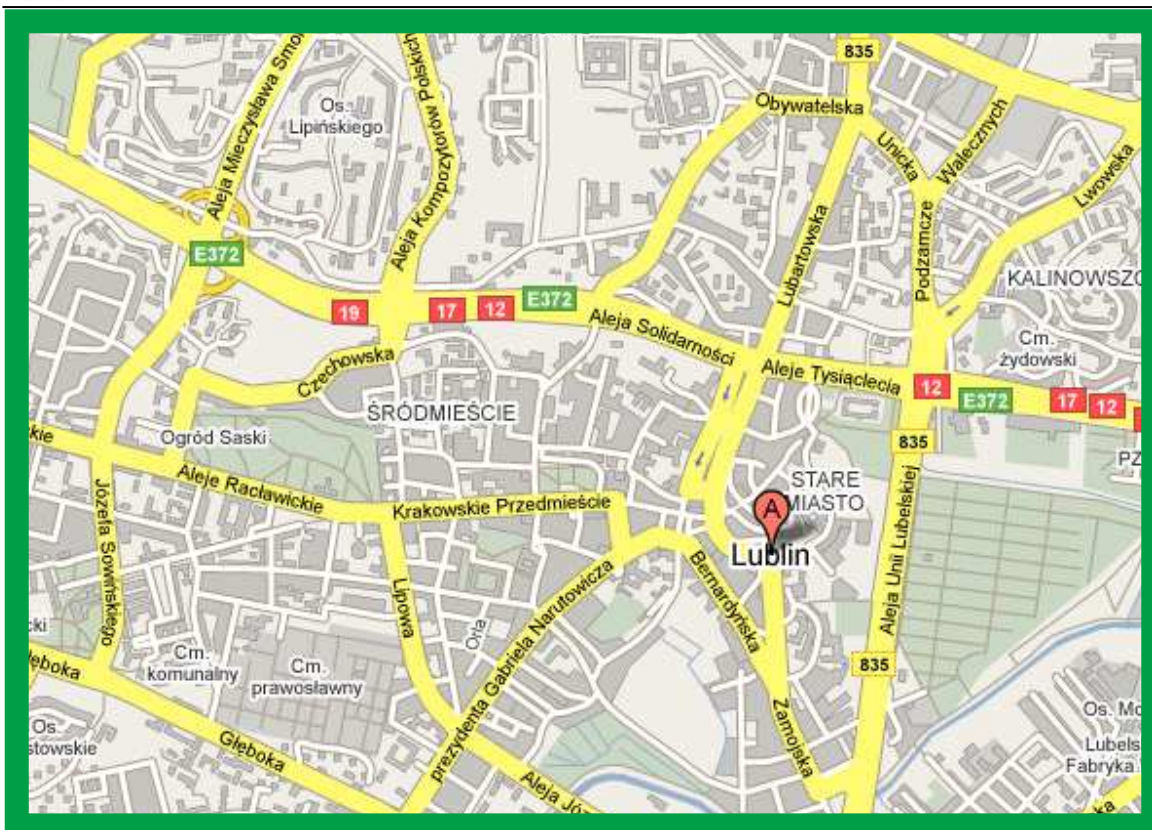
Mapa Lublina z zaznaczonym położeniem szkoły