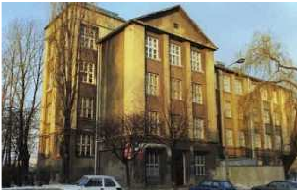
Budynek szkoły przy ul. Spokojnej 10

W latach 70-tych do głównego budynku dobudowano salę gimnastyczną. Przez kolejne lata wykonywane były prace remontowe: wymiana stolarki okiennej, gruntownie wyremontowano salę gimnastyczną, nawierzchnię podłóg korytarzy, założono system alarmowy i monitoring budynku. Ponadto cyklicznie malowane są korytarze i pracownie lekcyjne. Ze względu na „wiek” koniecznie gruntownego remontu wymaga elewacja budynku i dach.