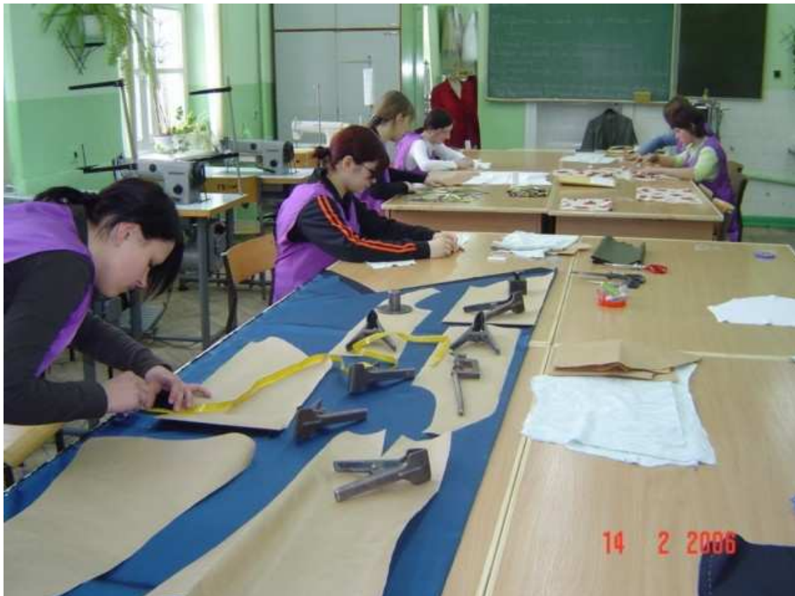
Zajęcia w pracowni krawieckiej