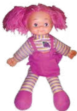
lalka - a doll