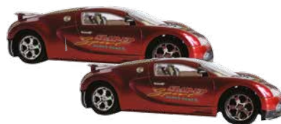
samochody - cars