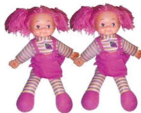
lalki - dolls