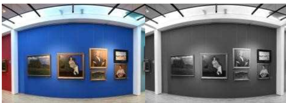
Koperta 3: „Galeria malarstwa polskiego XIX i XX wieku”