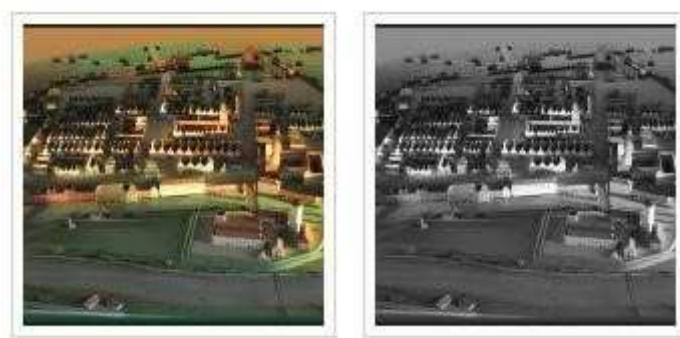
Koperta 2: „Makieta Opola z poł. XVIII w. – część stałej wystawy historycznej”