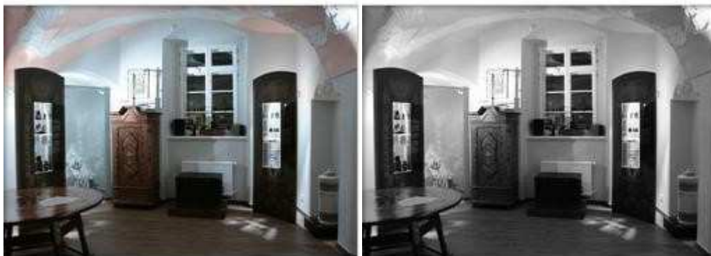
Koperta 4: „W kręgu farmacji”