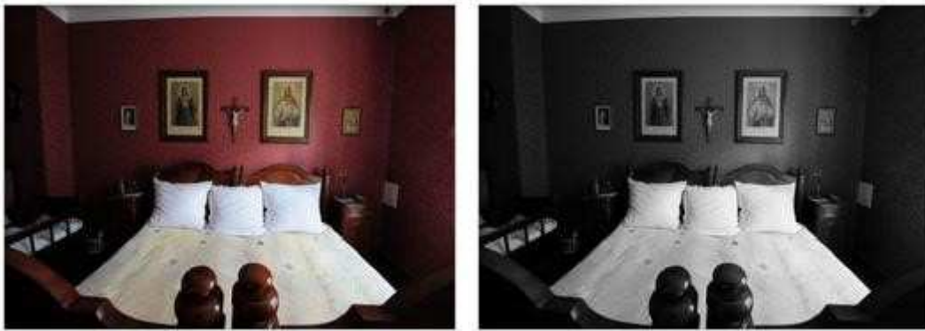
Koperta 5: „Kamienica czynszowa przy ul. św. Wojciecha 9 w Opolu”