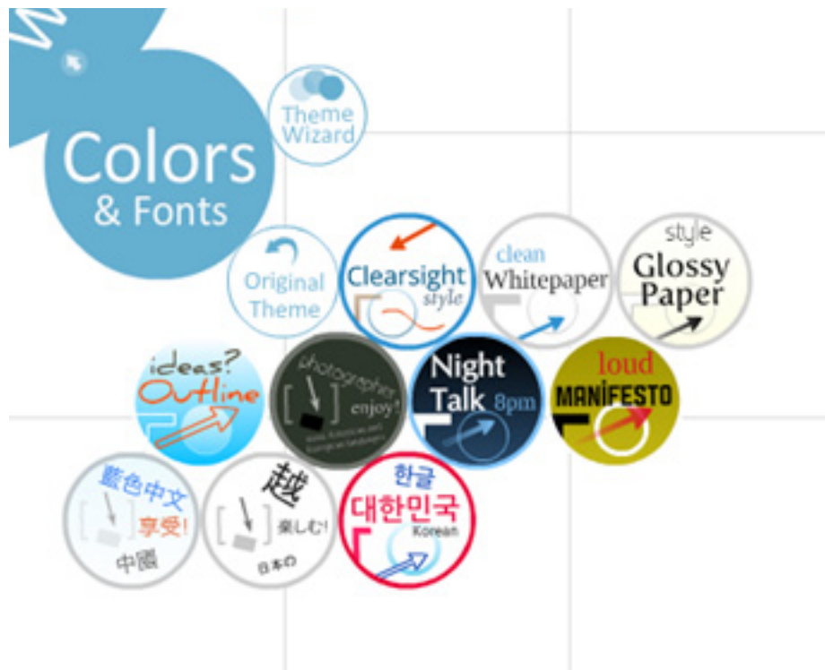
Rysunek 2. Narzędzie Colors &amp; Fonts