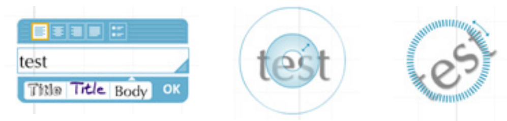
Rysunek 3. Formatowanie tekstu

Ostatnim etapem jest wprowadzenie punktacji do fragmentu tekstu i wykorzystanie opcji podstawowych narzędzi edycji, by utworzyć punkty.