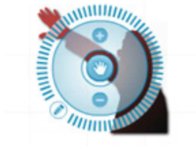
Rysunek 5. Edycja grafiki

Analogicznie uczestnicy umieszczają na powierzchni prezentacji kilka innych obrazów.