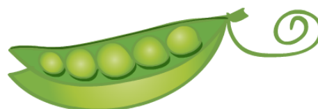
groszek - peas