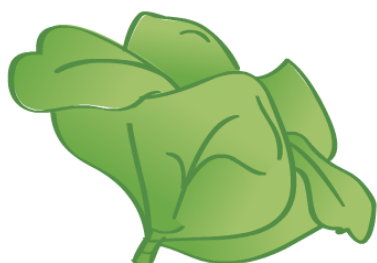
sałata - lettuce