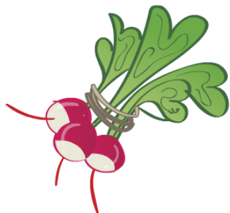
rzodkiewka – radish

Nauczyciel nazwy warzyw mówi w języku angielskim i zapisuje je w dwóch językach na tablicy