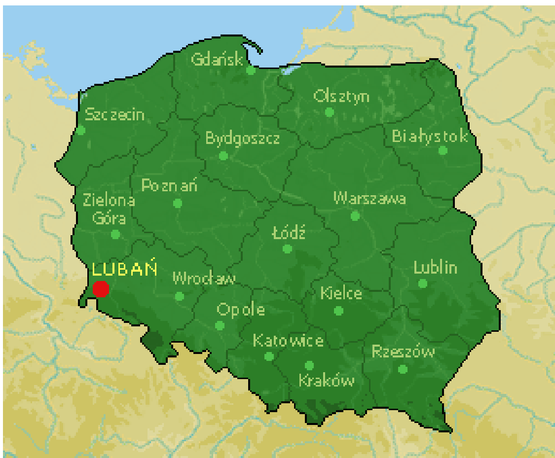
Rys. 1 Położenie powiatu lubańskiego na mapie Polski