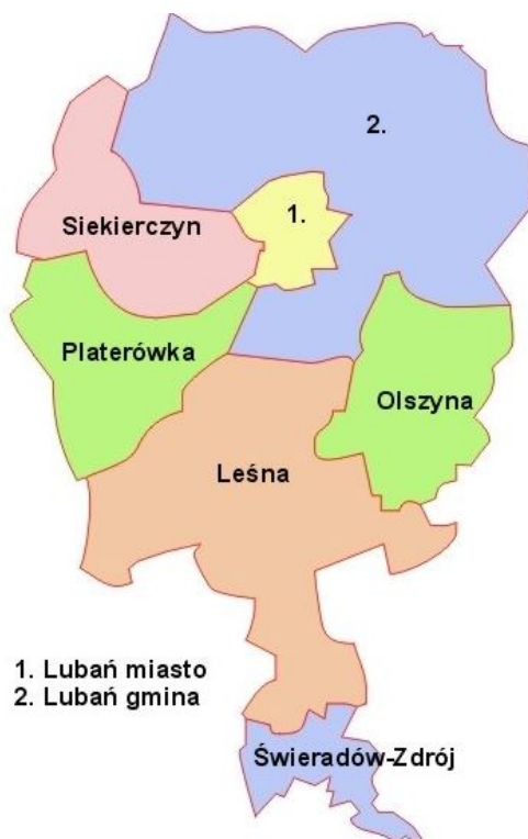
Rys. 2. Mapa powiatu lubańskiego: