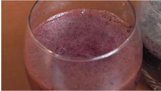
sok z cytryny

1) Rozpoznaj, czego dodano do każdej z tych szklanek i połącz podpisy ze zdjęciami.