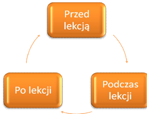
Wykres 1. Cykliczny model planowania lekcji (Woodward 2001)

Projekt współfinansowany przez Unię Europejską w ramach Europejskiego Funduszu Społecznego