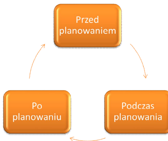
Wykres 2. Etapy planowania.