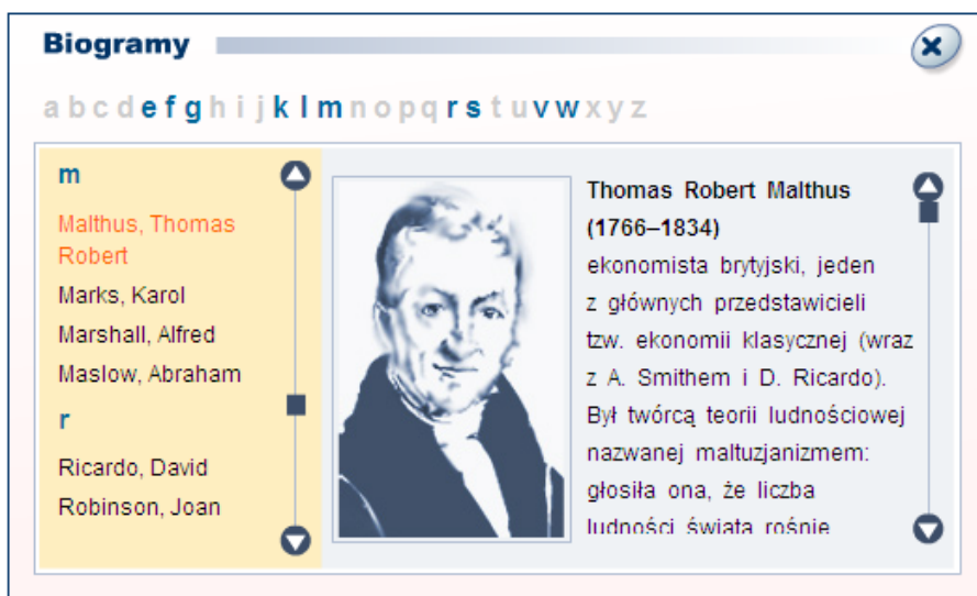
Rysunek 13: Okno Biogramu