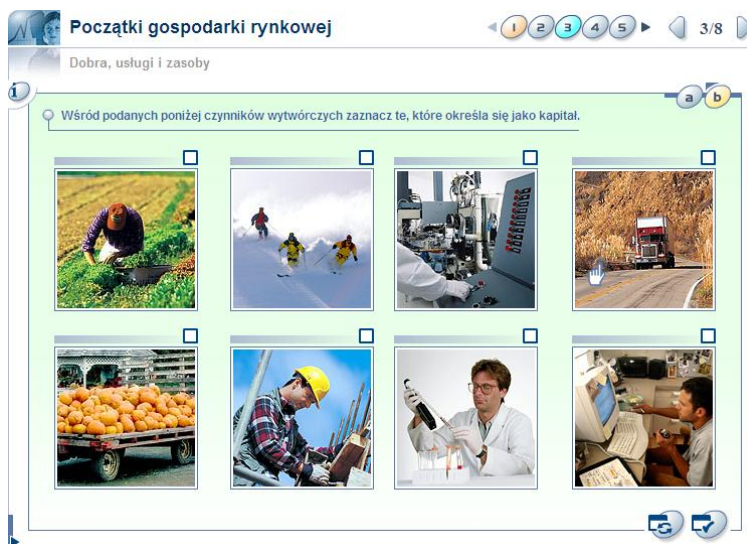
Rysunek 2: Przykład ekranu lekcyjnego z ćwiczeniem

Dodatkowo, w kursie można znaleźć strony zawierające zadania praktyczne dla ucznia. Ideą takich ćwiczeń jest zwiększenie praktycznego aspektu kursu i zastosowanie zdobytej wiedzy do rozwiązywania codziennych problemów.