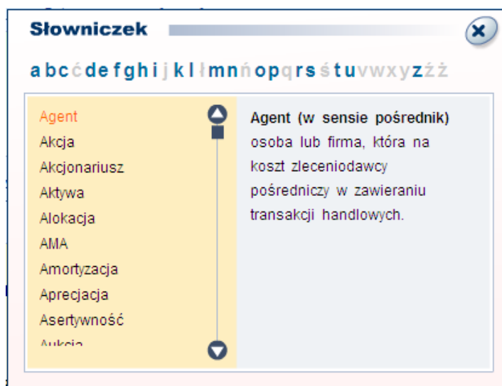
Rysunek 12: Okno Słowniczka