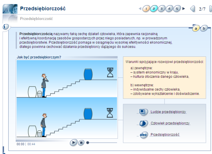
Rysunek 1: Przykładowy ekran lekcyjny zawierający animację

Ten typ strony zawiera materiał, który jest prezentowany uczniowi. Treści nauczania mogą być przedstawiane za pomocą tekstów, animacji, pokazów slajdów, nagrań lektorskich czy też ilustracji i zdjęć. Materiał jest przygotowany w taki sposób, aby proces nauki był dla ucznia atrakcyjny a zarazem efektywny.