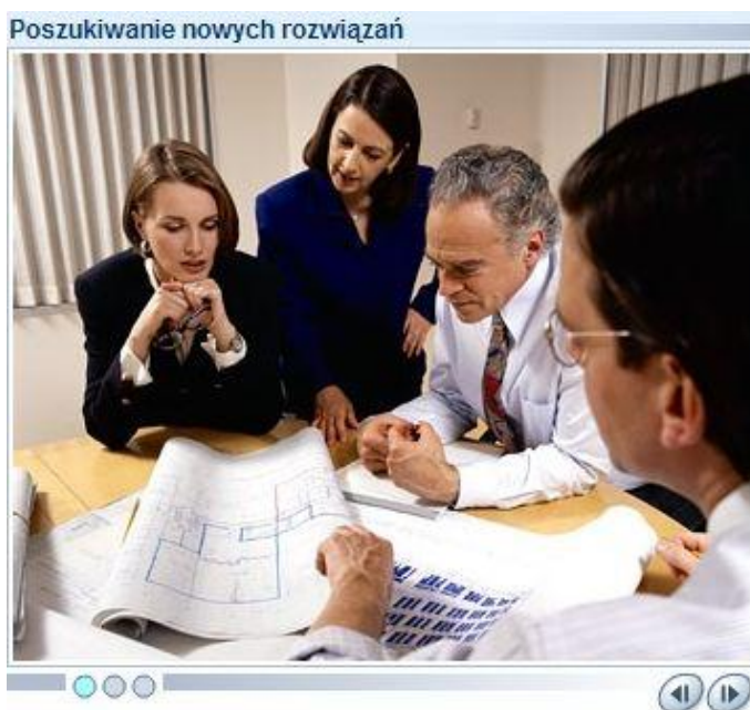
Rysunek 5: Pokaz slajdów bez narracji