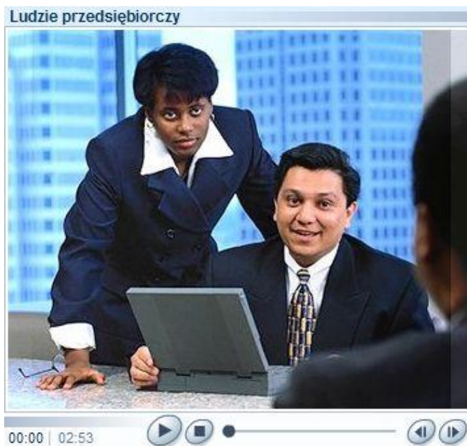
Rysunek 4: Pokaz slajdów z narracją