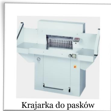
Krajarka do pasków