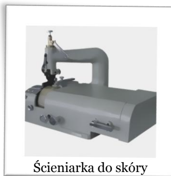
Ścieniarka do skóry