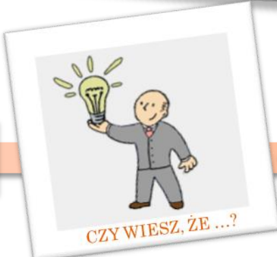
CZY WIESZ, ŻE ...?