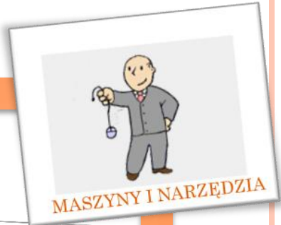
MASZYNY I NARZĘDZIA