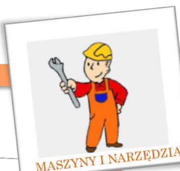
MASZYNY I NARZĘDZIA