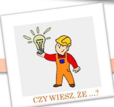
CZY WIESZ, ŻE ...?