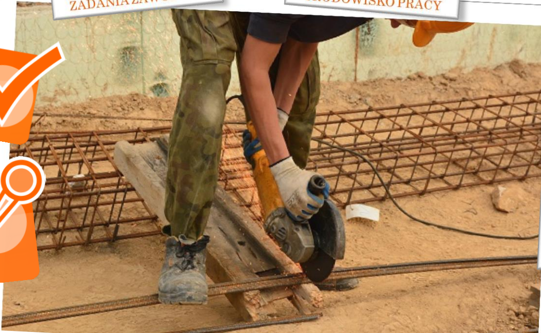
MONTER KONSTRUKCJI BUDOWLANYCH