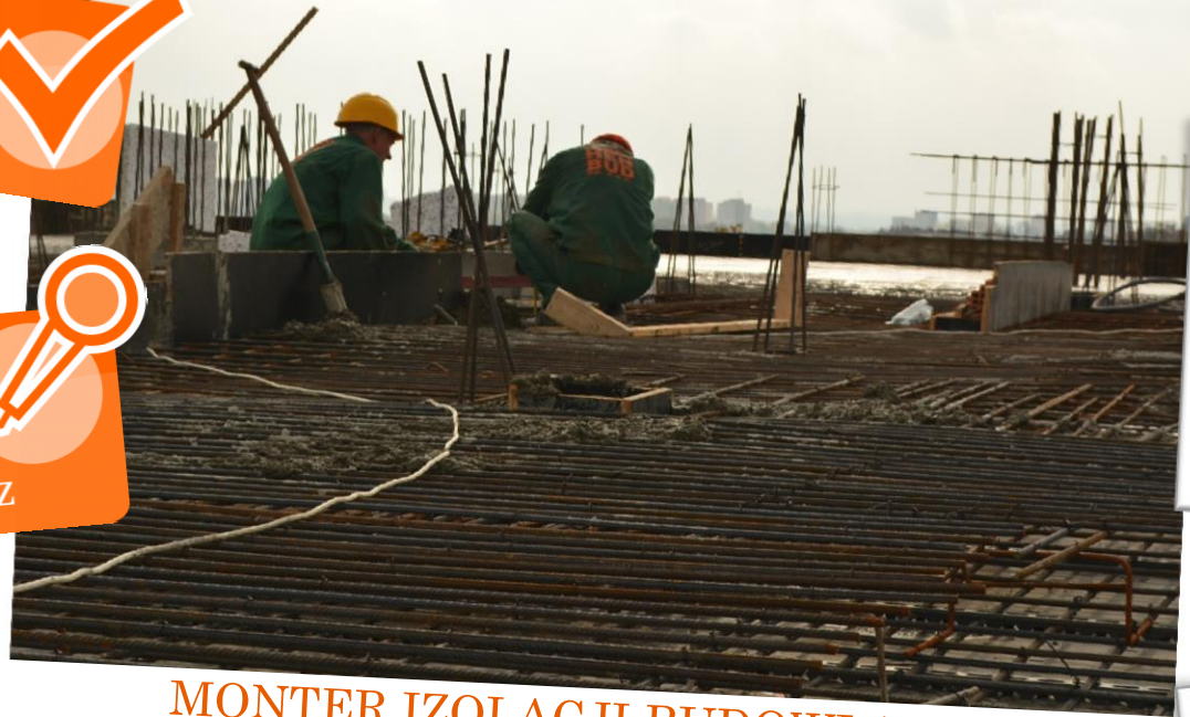
MONTER IZOLACJI BUDOWLANÝCH