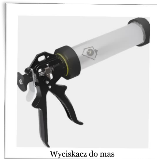
Wyciskacz do mas