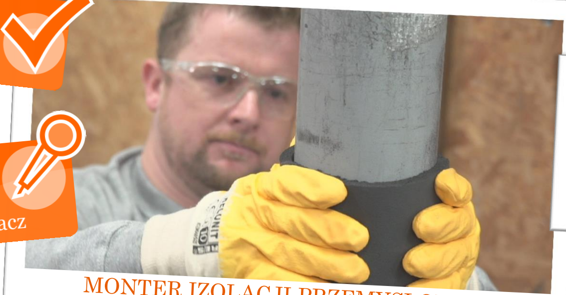
MONTER IZOLACJI PRZEMYSŁOWYCH