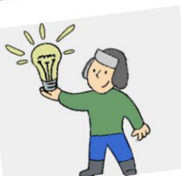
CZY WIESZ, ŻE ...?