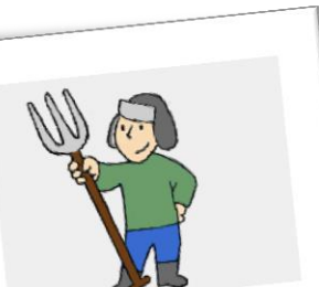
MASZYNY I NARZĘDZIA