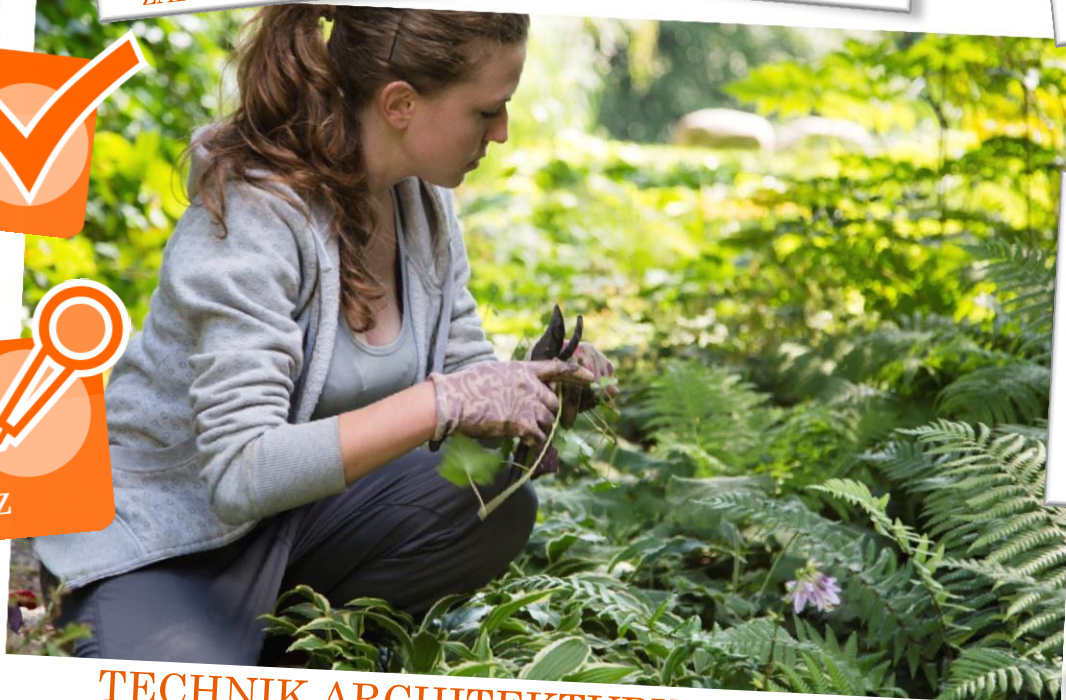
TECHNIK ARCHITEKTURY KRAJOBRAZU