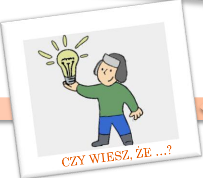
CZY WIESZ, ŻE ...?