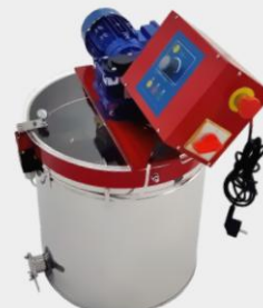
URZĄDZENIE DO KREMOWANIA MIODU