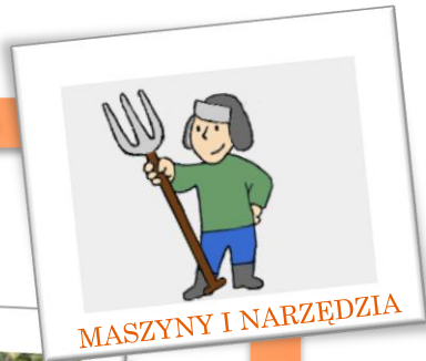
MASZYNY I NARZĘDZIA