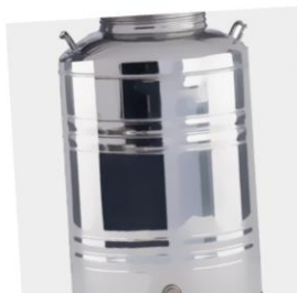
BAŃKI NA MIÓD