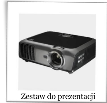
Zestaw do prezentacji