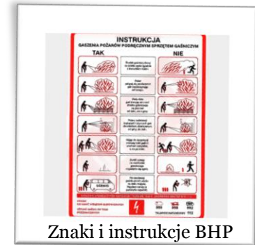
Znaki i instrukcje BHP