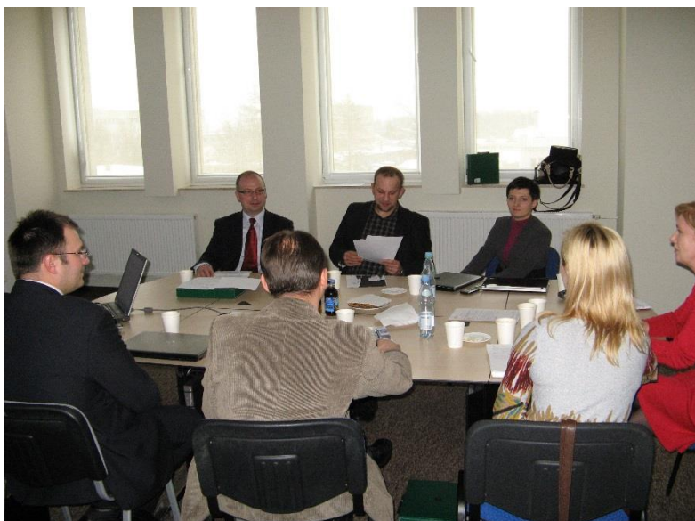
Eksperti i moderatorzy z branży informatycznej w trakcie dyskusji.