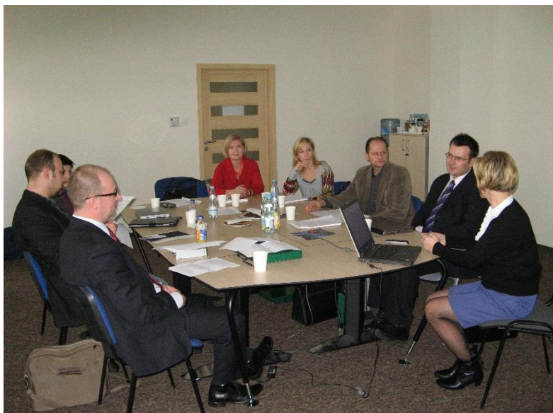
Eksperti i moderatorzy z branży informatycznej w trakcie dyskusji.