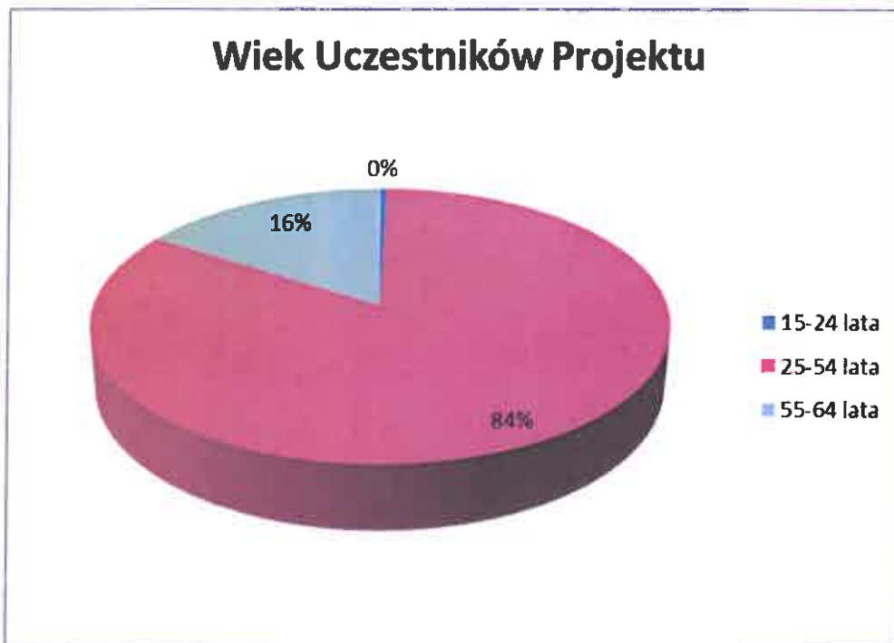
Wykres nr 2.

Największą liczebność w grupie nauczycieli/instruktorów biorących udział w projekcie stanowiły osoby w wieku 25-54 lat co stanowi 84% wszystkich uczestników.