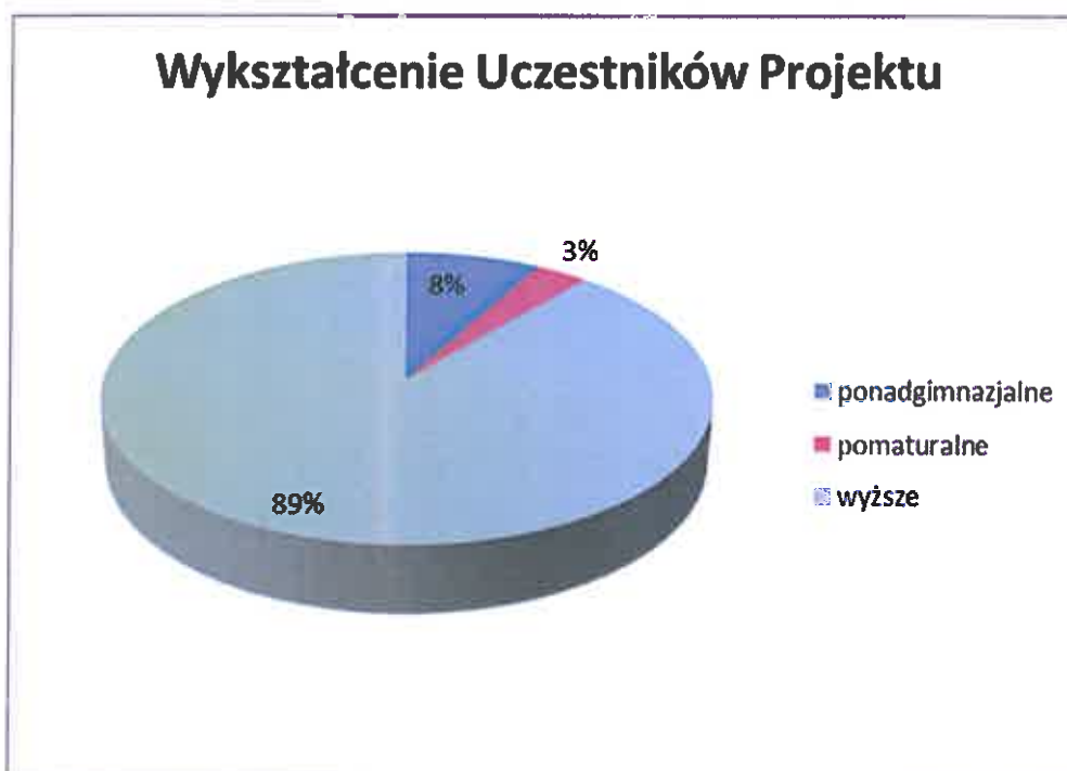
Wykres nr 3.

Największą liczebność w grupie nauczycieli/instruktorów biorących udział w projekcie stanowiły osoby w wieku 25-54 lat co stanowi 84% wszystkich uczestników.