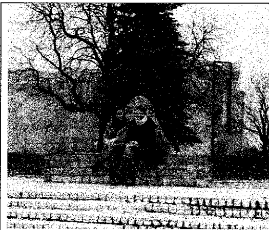
W Parku Ocalałych

Zajęcia odbyły terminach: 21 i 22 listopada 2012 roku. Pierwsze spotkanie miało charakter kameralny i trwało 1 godzinę. Uczniowie zapoznali się z kartą pracy - udostępnioną na Platformie SuperMemo i wypełnili ją, szukając odpowiedzi na pytania w Internecie. Drugie spotkanie odbyło się następnego dnia i było wycieczką krajoznawczą. Długa podróż pozwoliła na zapoznanie się uczniów z planem miasta i odszukanie na nim głównych obiektów zwiedzania. Przejście przez miasto z planem w ręce było dla niektórych dość trudne, ale wspólnymi siłami zdołaliśmy dotrzeć do wszystkich zaplanowanych miejsc. Zdjęcia poniżej świadczą o dobrej zabawie na wycieczce.