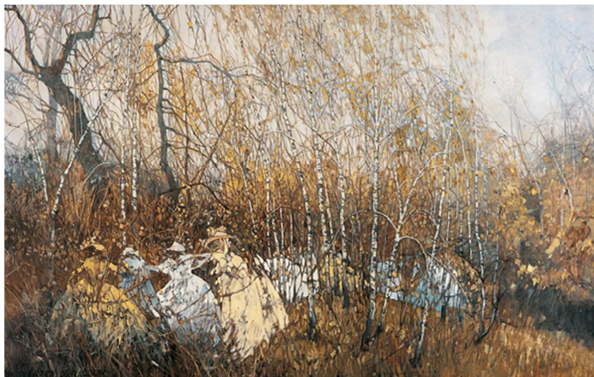
2683 - Walc As-dur op. 34 nr 1

http://www.galeriedorotakabiesz.com/images/exhibitions/2007_3_chopinowi_duda_gracz_i_olejniczak/2007_chopin_05.jpg