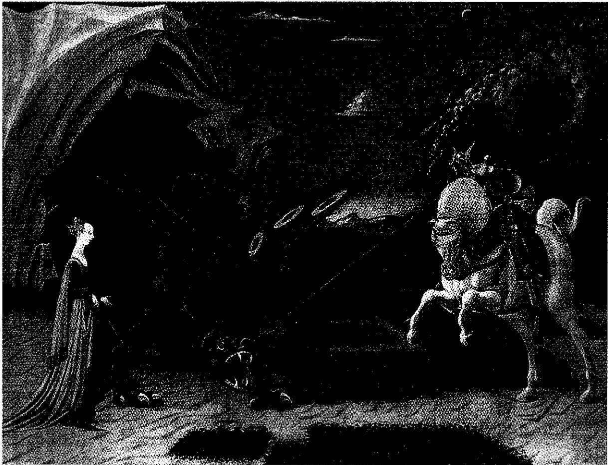
Paolo Uccello - Św. Jerzy ze smakiem (Londyn)